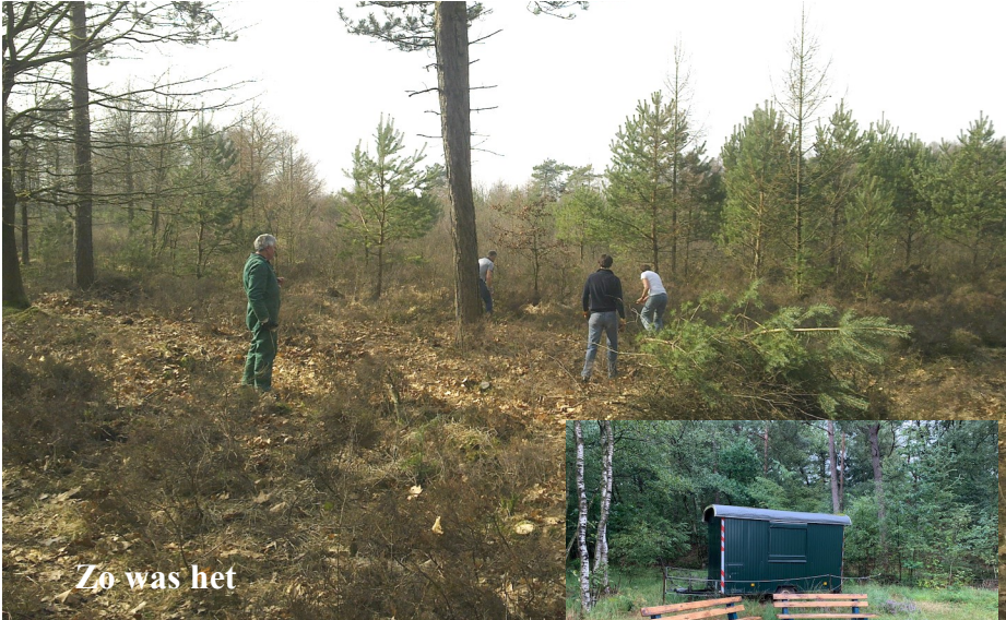
Zo was het

En dan is daar opeens de hei een enorme paarse ruimte! Wat een verschil met zo'n 10 jaar geleden, toen was het daar bos met veel Amerikaanse jonge eikjes... en nu...? Geweldig gedaan Bosploeg! Saskia