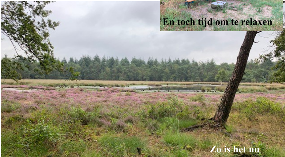
Zo is het nu