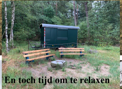
En toch tijd om te relaxen